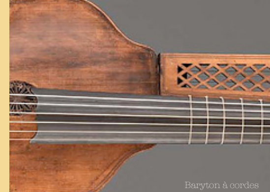
Baryton à cordes

SAMEDI 23 NOV. Salon d'Honneur de la Mairie Niort – 20h30