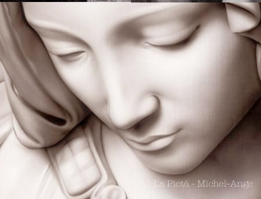
La Pieta - Michel-Ange